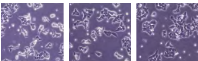
図1 解凍後48時間のHAP1クローン